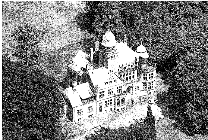
1908 wollte ein Bremer Kaufmann mit dem Bau des Herrenhauses Grabau bei Bad Oldesloe an die Herrlichkeit der Schloss- und Herrenhausarchitektur anknüpfen; heute steht es weitgehend leer.